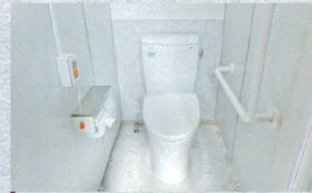
トイレ 使いやすさを第一に考えた設計。