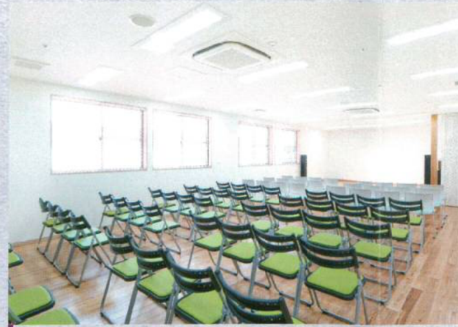
集会室 みんなで集まるときに。広々としたスペースで、レクリエーションなど多目的に使えます。

事業内容／養護老人ホーム 運営／社会福祉法人寿敬会 建物構造／木造平屋建て 3棟構成 敷地面積／6,454㎡（約2,000坪） 延床面積／2,440㎡（約740坪） 居室総数／60床（全個室） 居室面積／12㎡（約7畳）