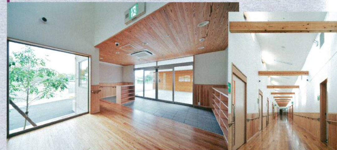
燦々と光が差し込む明るい広々とした開放的なエントランス。まっすぐな廊下とシンプルな部屋の配置で、車椅子でもラクラク移動出来ます。