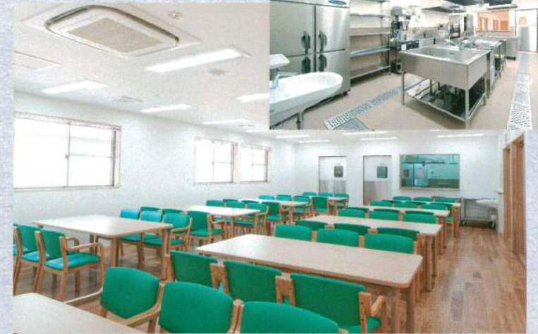
食堂・厨房 清潔な厨房から、あたたかくて体にやさしい食事を提供いたします。